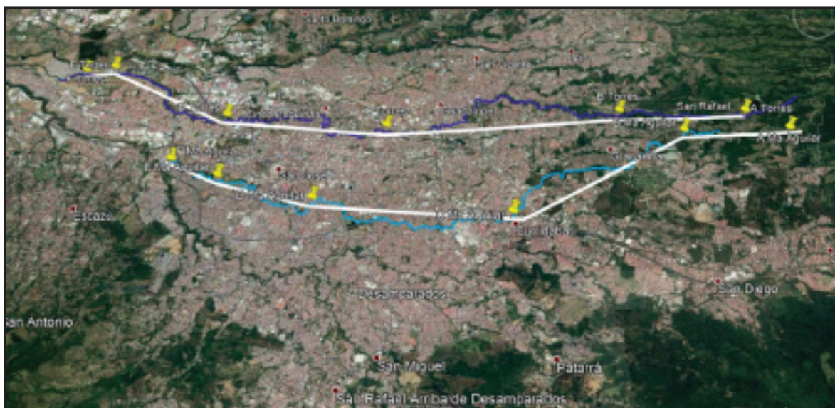
Figura 1. Puntos de muestreo en los ríos Torres y María Aguilar.

De parte de la Unidad Ejecutora de Control y Gestión Ambiental, el Laboratorio Nacional de Agua (LNA) y la Unidad Ejecutora del Programa de Agua Potable y Saneamiento (UE-PAPS) del AyA, se han realizado dos campañas de muestreo durante el 2021 que se suman a las tres realizadas en el 2020 para el análisis de la calidad de agua de los ríos Torres y María Aguilar. El objetivo principal es finalizar con la línea base de información sobre la calidad de los cuerpos de agua a través de un monitoreo representativo con una periodicidad trimestral a lo largo de ambas microcuencas (ver figura 1). Esto mediante la toma de muestras en cada cuerpo de agua para análisis y determinación de parámetros fisicoquímicos, microbiológicos y biológicos a través del estudio de macroinvertebrados bentónicos definidos como metodología de control ambiental dentro de la Estrategia Nacional Ríos Limpios y según lo establecido por el Decreto No. 33903-MINAE-S (Reglamento para la Evaluación y Clasificación de la Calidad de Cuerpos de Agua Superficiales) (ver Anexo 1 y 2).